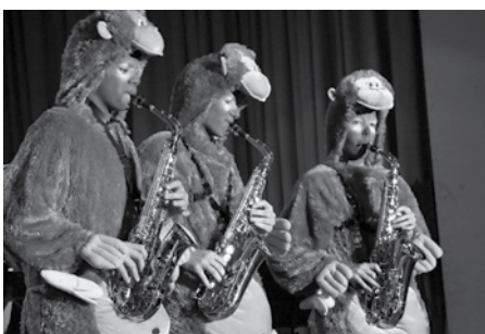
Winterkonzert 2014 Motto Filmfestival

Was wir in der ersten Hälfte des diesjährigen Vereinsjahres bereits erlebt haben, können Sie auf den folgenden Seiten lesen. Wir wünschen Ihnen viel Spass dabei.