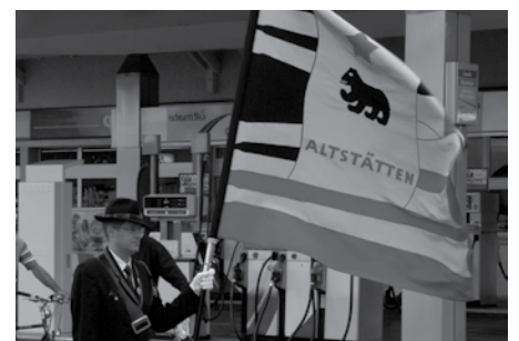
Kantonales Musikfest Diepoldsau