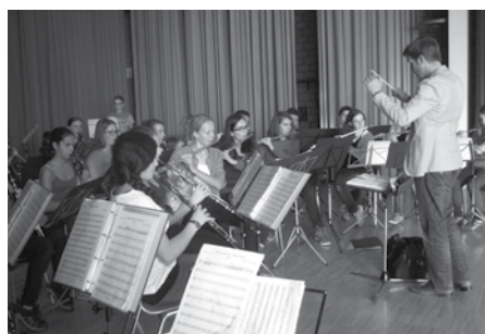
Vorbereitung Jugendmusikfest, Buchs